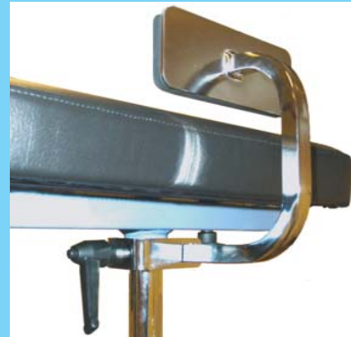
Sidostöd kpl par Art. nr. 300015710