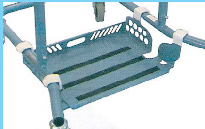
Ståplatta Art. nr. 300015780