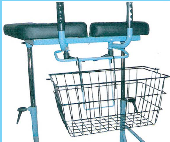
Hållare Korg Art. nr. 300715730 Art. nr. 300014110