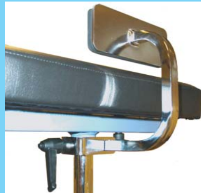
Sidostöd kpl par Art. nr. 300015710