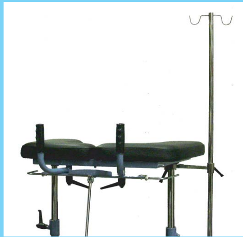
Droppställning Art. nr. 300015720