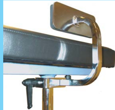
Sidostöd kpl par Art. nr. 300015710