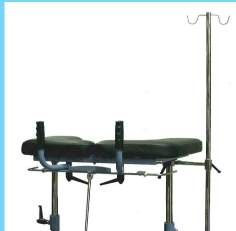
Droppställning Art. nr. 300015720

SMK AB Öm Västra Backgården 541 36 Skövde