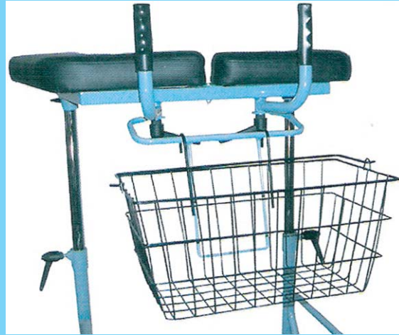
Hållare Art. nr. 300715730 Korg Art. nr. 300014110