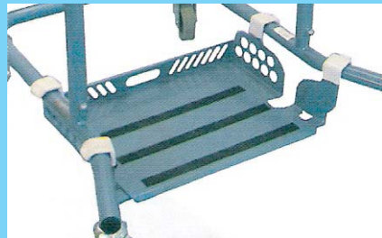
Ståplatta Art. nr. 300015780