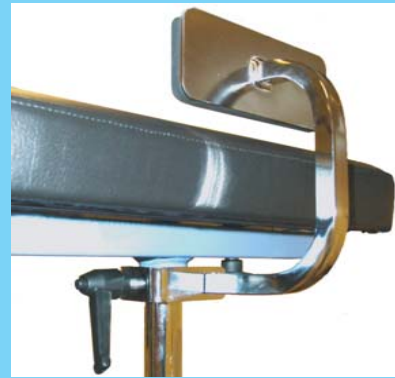
Sidostöd kpl par Art. nr. 300015710