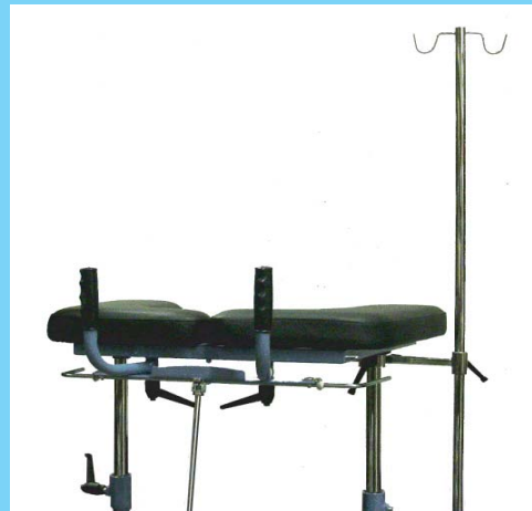
Droppställning Art. nr. 300015720