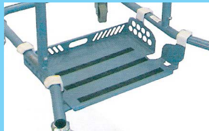
Ståplatta Art. nr. 300015780