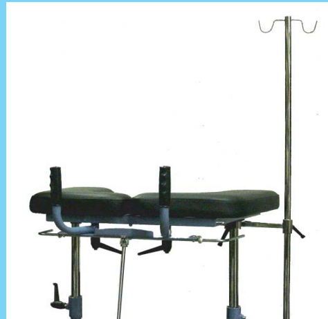
Droppställning Art. nr. 300015720