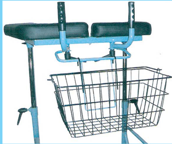
Hållare Art. nr. 300715730 Korg Art. nr. 300014110